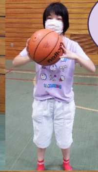
しょくじ まえ 食事の前に かる うんどう 軽く運動