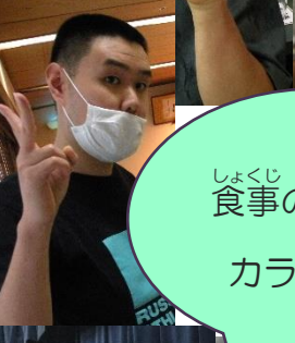
しょくじ あと 食事の後は、 カラオケ♪